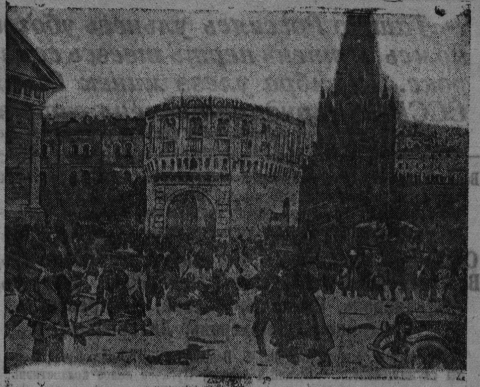
Комсь иеде теде икеле. Октябрьской Социалистической Ине революциянь читлестэ. СНИМКАСОНТЬ: Кремлянтэ саемадо икеле Троицкой ортатнень вакссо

Шумбра улезз весе мирэнь трудиятнень минек родной, вечкевикс ине вождесь—ИОСИФ ВИССАРИОНОВИЧ СТАЛИН!