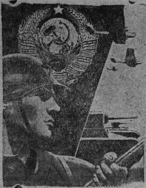
Советской народонть ули мезе ванстамс, ули кинень ванстомс, ули мейсэ ван- стомс.

Робочей классось торжествовал победанть. Октябрюнь 25-це чистэ домка волнения марто петрогра-