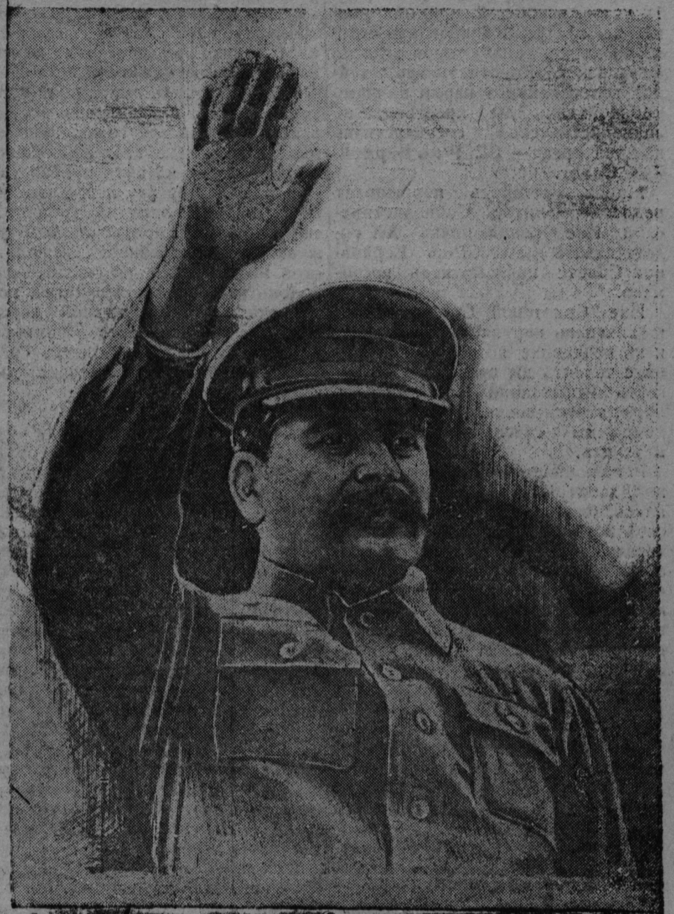
И. В. СТАЛИН «И. В. Сталин» альбомостокть, конань Союзфотос издательствась колдызе Октябрьской Социалистической Ине революциянь 20-це годовщиантень.

Ромодановань районь «Якстере сокиця» колхозонь колхозниктнень ды колхозницатне Союзонь Советс депутаткс кандидатокс аравтызь