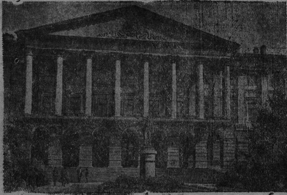
Октябрьской Социалистической Ине революциянь XX-це годовщи- нантень. СНИМКАСОНТЬ: Октябрьской восстаниянь штабонт—Смоль- ноенть зданиясь.