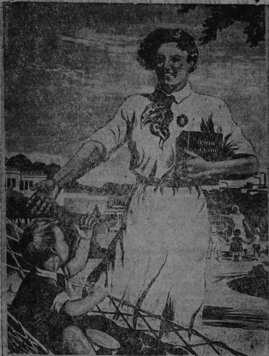
КАЙ ЖИВЕ РІВНОПРАВНА ЖІНКА СРСР. АКТИВНА УЧАСНИЦЯ В УПРАВЛІННІ ДЕРЖАВОЮ. УПРАВЛІННІ ГОСПОДАРСЬКИМИ І КУЛЬТУРНИМИ ПРАВАМИ КРАЇНИ!

СНИМКАСОНТЬ: М. Юрнук художникентъ плакатозо, конань нолдызе „Искусство“ Украинань издательствась.