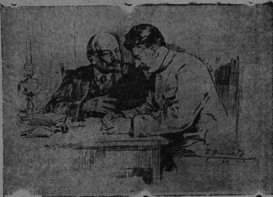
Октябрьской-революциянь комсеце годовщинантень. В. И. ЛЕНИН кортни И. В. СТАЛИН марто рабочеень квартирасо Петроградсо (1917 ие).

Союзонь Советс васень кандидатокс народось аравтызе мировой пролетариатонь вожденть Сталин ялганть ды сонзэ сех вадря сора-никтнень. Минь—советской од ломантне, макссынек эсь вальгеенек сех вадря ломантнень кис, конат педепев преданнойть Ленинэнь-Сталинэнь теветень, социализмань кис, рабочейтнень ды крестьянтнэнь счасияст кис непоколебимой бороциятнень, ды васняк советской од ломантнень вечкевикс оянтъ, тетянтъ кисэ, конань пельде минь тонавтицяно эрямо, бороцямо ды изнямо;—Сталин ялганть кис.