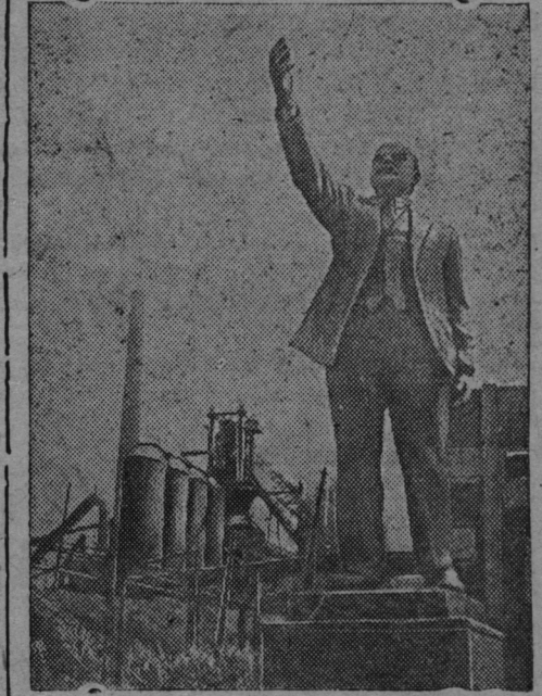
Октябрьской Социалистической Ине революциянь 20 годовщинантень (СССР-нь СНК-со искусствань тевтнень коряс комитетэсь организови фотонискуствань выставка.