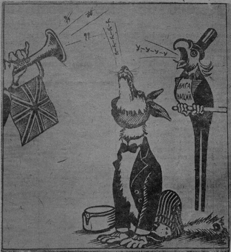
Белофинской вергизэнь ды женевакой попугаень дуэтсь. (Фото-клише ТАСС).