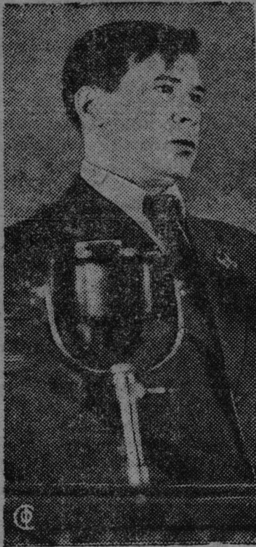
НА СНИМКЕ: секретарь ЦК ВЛКСМ тов. Косарев.

Будем учиться так, чтобы тов. Сталин сказал: „отлично ребята“