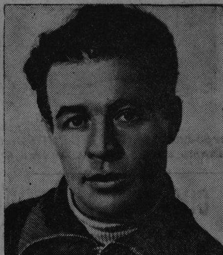
Советской Союзонь героитне ШМИДТ, ПАПАНИН, МОЛОКОВ ялгатне