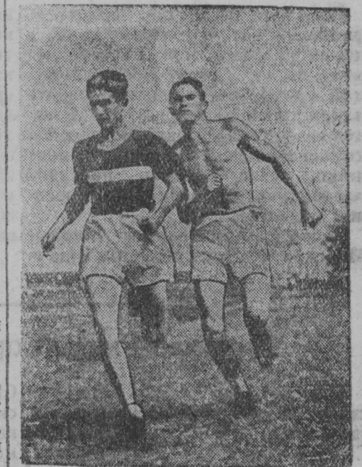
Рузаевкасо физкультурной парадось.

(„Колхозная стройка“ районной газетасонть).