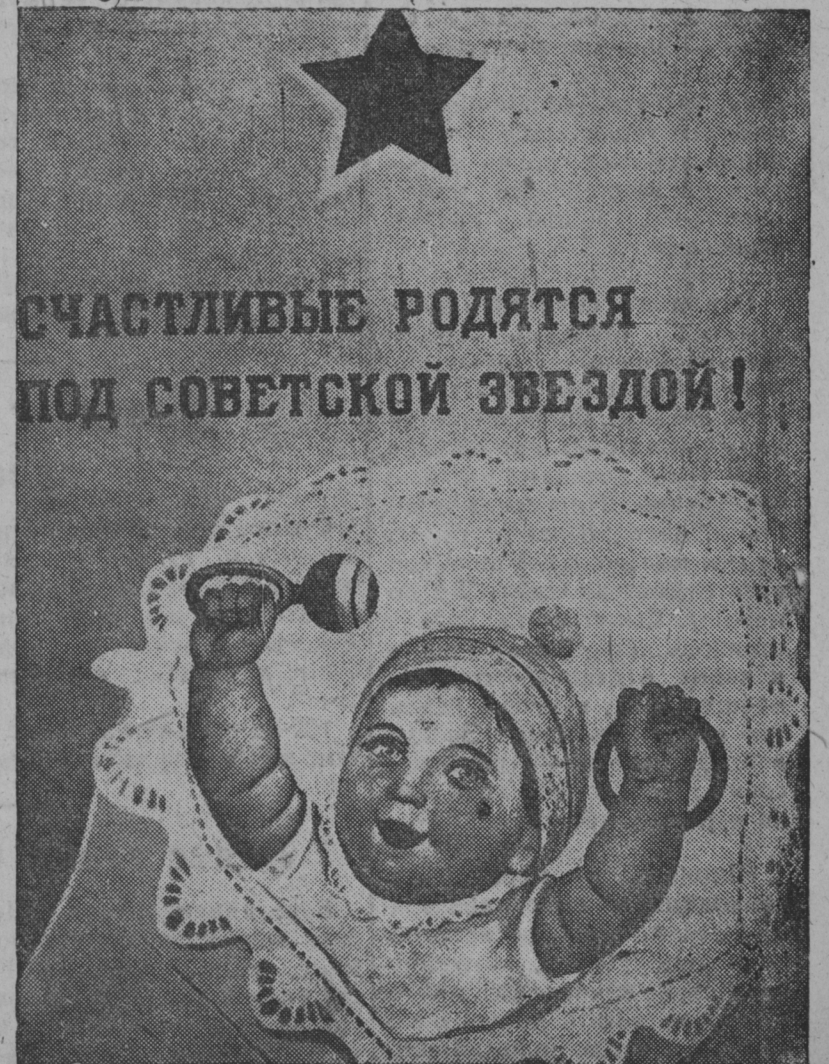
СНИМКАСОНТЬ: Говорков художникенть роботань плакатось— „Уцяскатнэ пачить советской тештентэ ало“ плакатнэнь сериясо, конатнень молдызе Изогизэсь пролетарской ине революциянь XIX-це годовщиантнень.