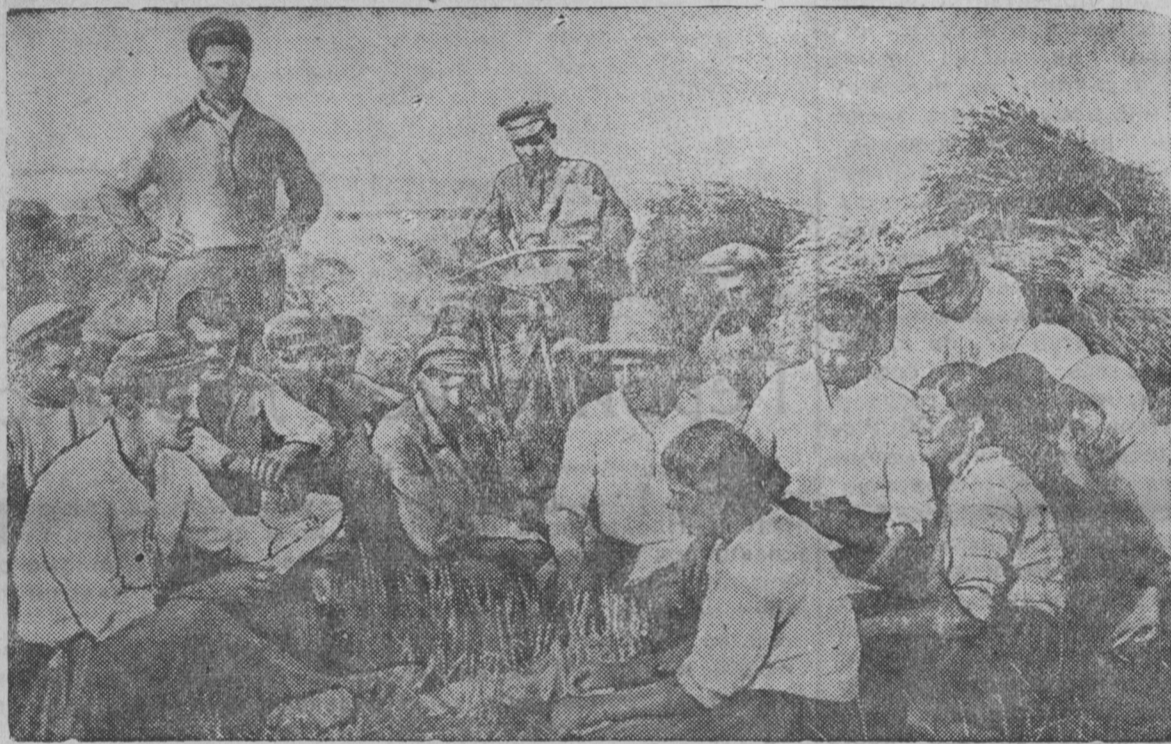
„Коминтерн“ колхозсонть (Белое веле, Виноцкой область) Конституциянь од проектэнт толковамось.

Кочкурова. „Од эрвамо“ колхозсо, васень бригадасонть нуиматнень прядомс ветявсь культурной робота. Паксян стансонть ульнэсть ноддазь стечной кавто газетат.