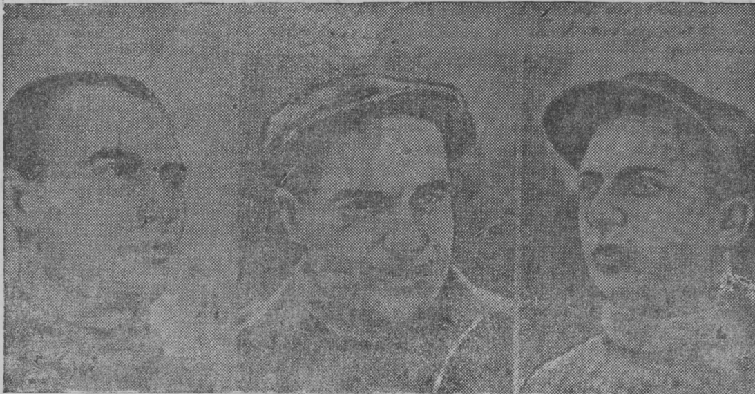
Советэнь союзонь героитне А. Беляков штурманось, самолетонь командирэсь В. Чкалов омбоце пилотось Г. Байдуков.