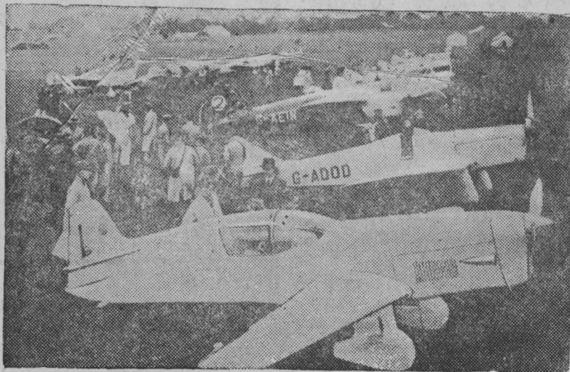
Лондонсо ульнесь „Королевской клубок“ приэнтъ кис коштонь традиционной состязаният. Состязаниясонть ульнесь 28 самолет.

Снимкасонть: состязаниянь участниктнэ аэродром лангсо самолетост.