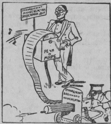
Видестэ тевс ютавтома. (рис. Айзен худ.)

Гибралтарсто (Испаниянь пеле чи ено мыс, средиземной иневедентень совамонтъ маласо) пачтить куля, што марокконской войскактнэ 2 эшалонт июлень 25 це чидентъ икеле вестэнтъ ютызь Гибралтарской проливонтъ. Войскактне валгсь Хеторес бухтанть (Алхесира ха ошонтъ маласо) ды тустъ Малага ошонтъ енов.