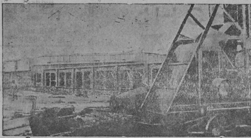
Сараяскоень пенько-джутовой комбинатонь строительствасонть. СНИМКАСОНТЬ: пенько-джутовой комбинатонь чесальной цехесь.