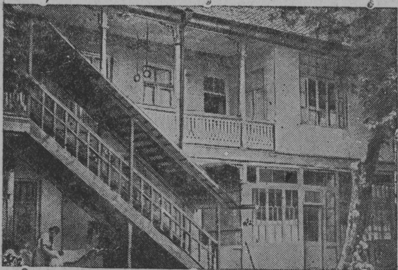
СНИМКАСОНТЬ: Тифлис ошко кудось, косо А. М. Горькоень 1891 иестэ ульнесь аволь покш комнатазо. Комнатась курок карми улеме ресторированной ды кудонтень ули теезь меморальной доска.

Таркатне косо эрясь ды роботась А. М. ГОРЬКИЙ