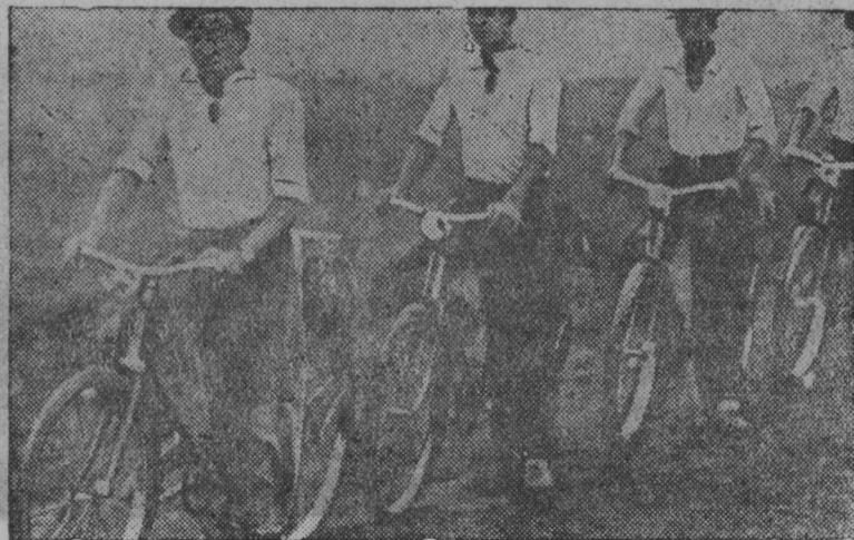
СНИМКАСОНТЬ: 4000 километрат велопробегень участниктне Саранскойста Горькоев ки лангсот