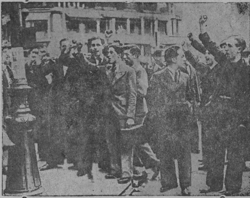
Сент-Лазарь вокзалонть вакссо Парижсэ теевсь столкновения фашистэнь распушенной Лиганъ члентнень ды народной фронтонъ приверженецтнень ютксо.

ПАРИЖСЭ ФАШИСТНЭНЪ ДЫ АНТИФАШИСТНЭНЪ МАРТО СТОЛКНОВЕНИЯСЬ