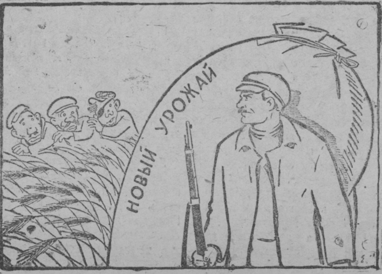
Ванотомс социалистической собственностень.