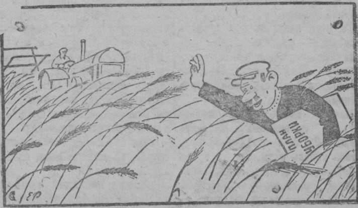
Иля уряда сюронтъ; эщө вейке колозь эзь кенерэ.