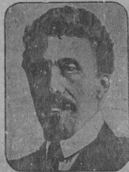
А. И. РЫКОВ.

Од организациась—ОСО—Авиахимесь—карми весе виензэ пучомо Советской Союзонь ванстоманте.