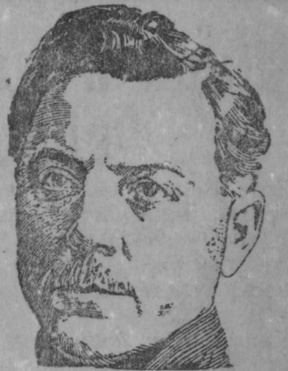
К. Е. ВОРОШИЛОВ.

Минсь асыргатано, но эськисэнек ащеме карматано.