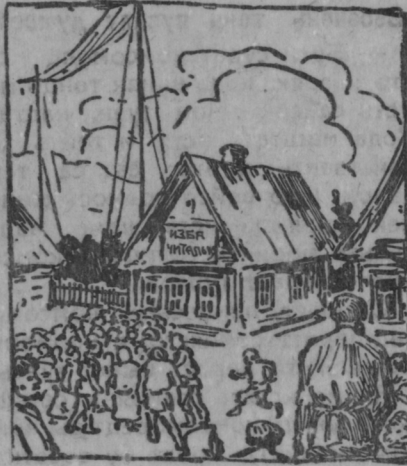
Учить, знярдо карми кортамо радясь.

Председателесь (РИК-сонть) тейсь докладт народонть ютксо,