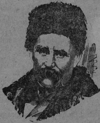
На снимке: Т. Г. Шевченко.

К 125 летию со дня рождения (9 марта 1814 г.) великого украинского поэта-революционера Т. Г. Шевченко.