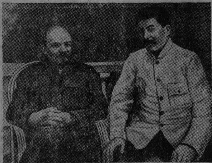
В. И. Ленин и И. В. Сталин в Горках. (1922 г.)

2. Редакция комсомольских газет широко освещать выполнение обязательств, взятых на себя комсомольцами и молодежью.