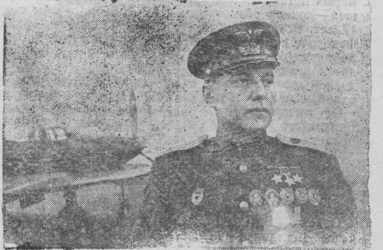
Трижды Герой Советского Союза гвардии полковник А. И. Покрышкин.