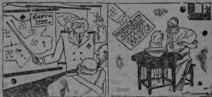
СўРЭТЫШТЭ: Карт да картычиз влак

Гэрманийыште киндым карточко дөн ужалат. Магазин-влакыште чэрэт влак ышталтын, продукто оз сита.