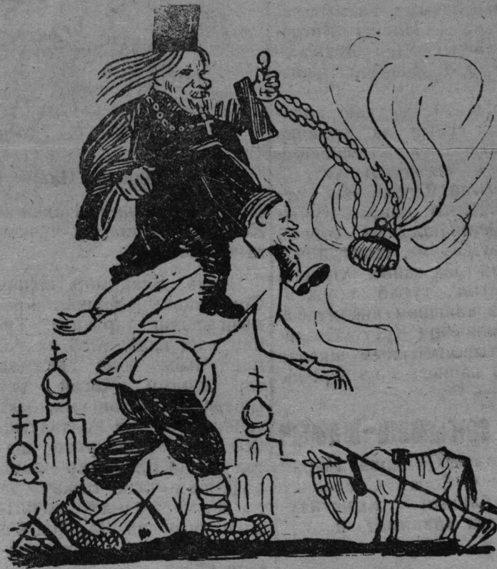
Поп-шамыч ожно тыгэ орландарэныт.

Абрамов йолташ 1934 ий дэч вара эрэк ВКП(б) Марий Обком плэnum члэн- лан сайлалтын. Маробко- мын 1937 ий декабрьысэ плэnumыштыжо Обкомын кумышо сэкратарьжылан сайлалтын.