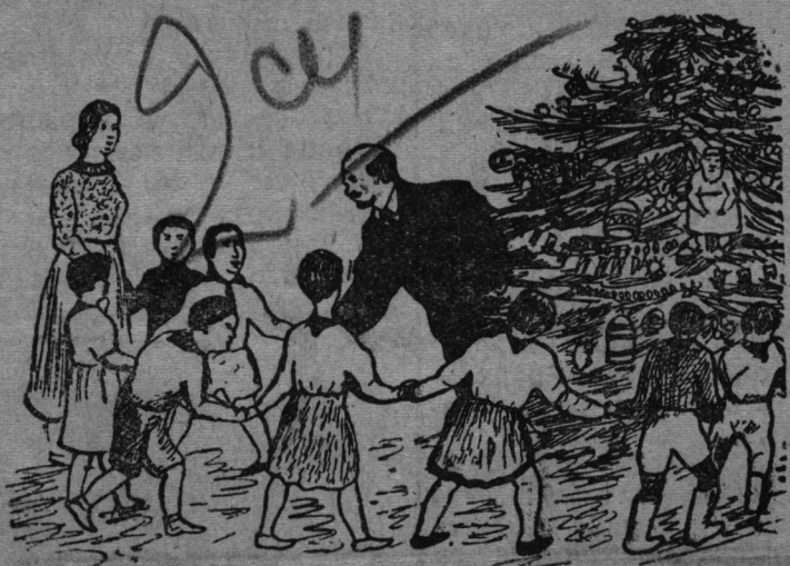
Владимир Ильич йолка найрэмыштэ.

Владимир Ильич Надэжда Константиновна дэч чучкыдын коштын.